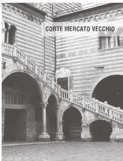
CORTE MERCATO VECCHIO